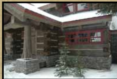
Nicola Logworks BC, Canada