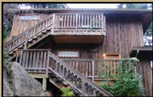
Maison Hastings. Salt Spring Island, BC, Canada

Ce produit écologique et non toxique est très apprécié des consommateurs et des entrepreneurs qui ne veulent nuire d'aucune façon à la qualité de l'environnement.