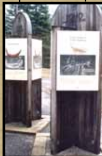
Yoho National Park Signs BC, Canada

LIFE TIME® enhances the natural beauty and grain of all types of wood. The initial colour ranges from grey to light brown to olive brown, depending on wood type, texture, and dryness. The natural colour matures to a beautiful silver patina. Natural weathering effects of sun, snow, and rain actually improve the qualities of LIFE TIME®.